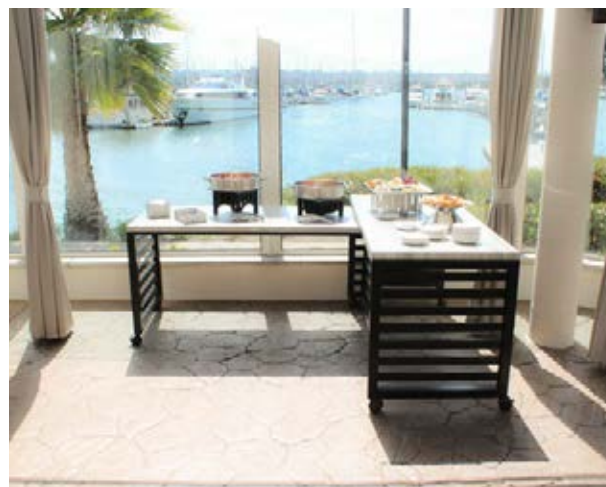
Sheraton San Diego Hôtel & Marina