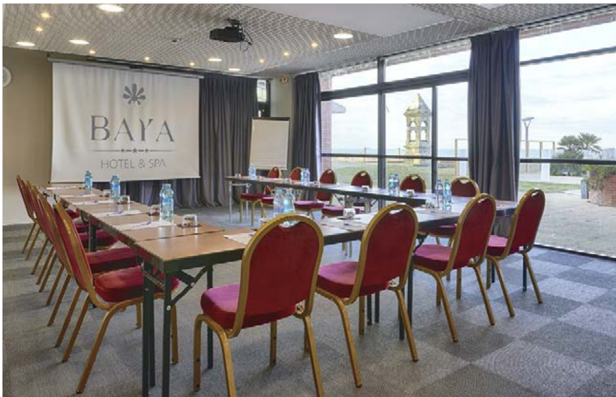
Baya Hôtel & Spa, Capbreton