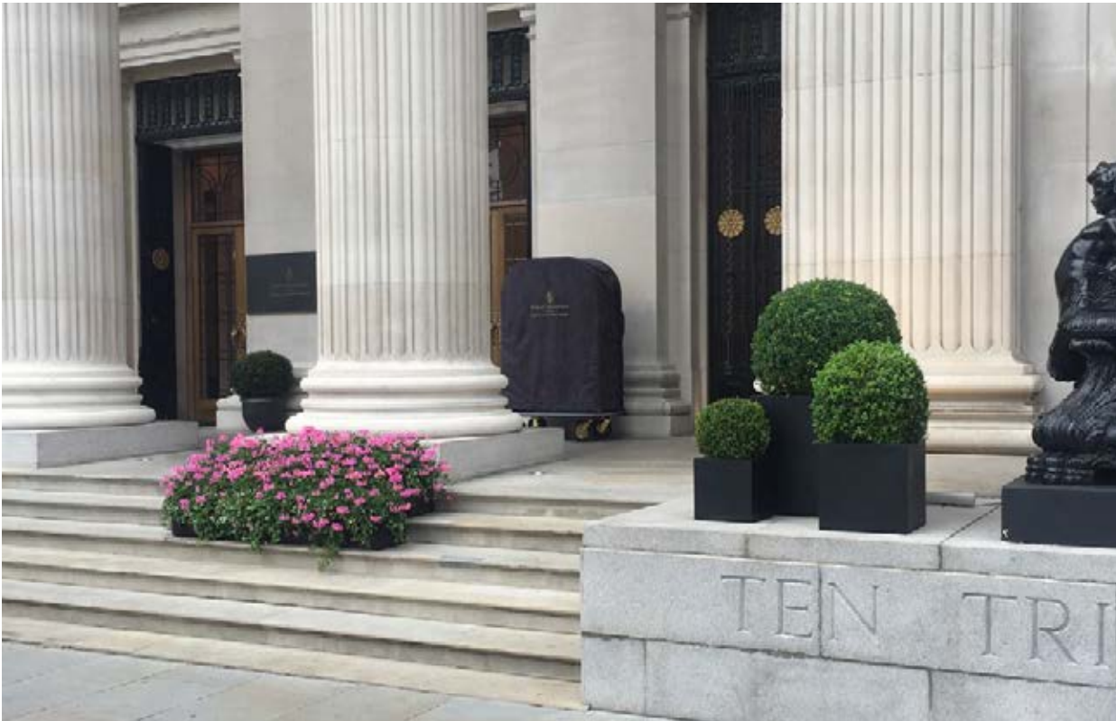
Four Seasons Hôtel London at Ten Trinity Square