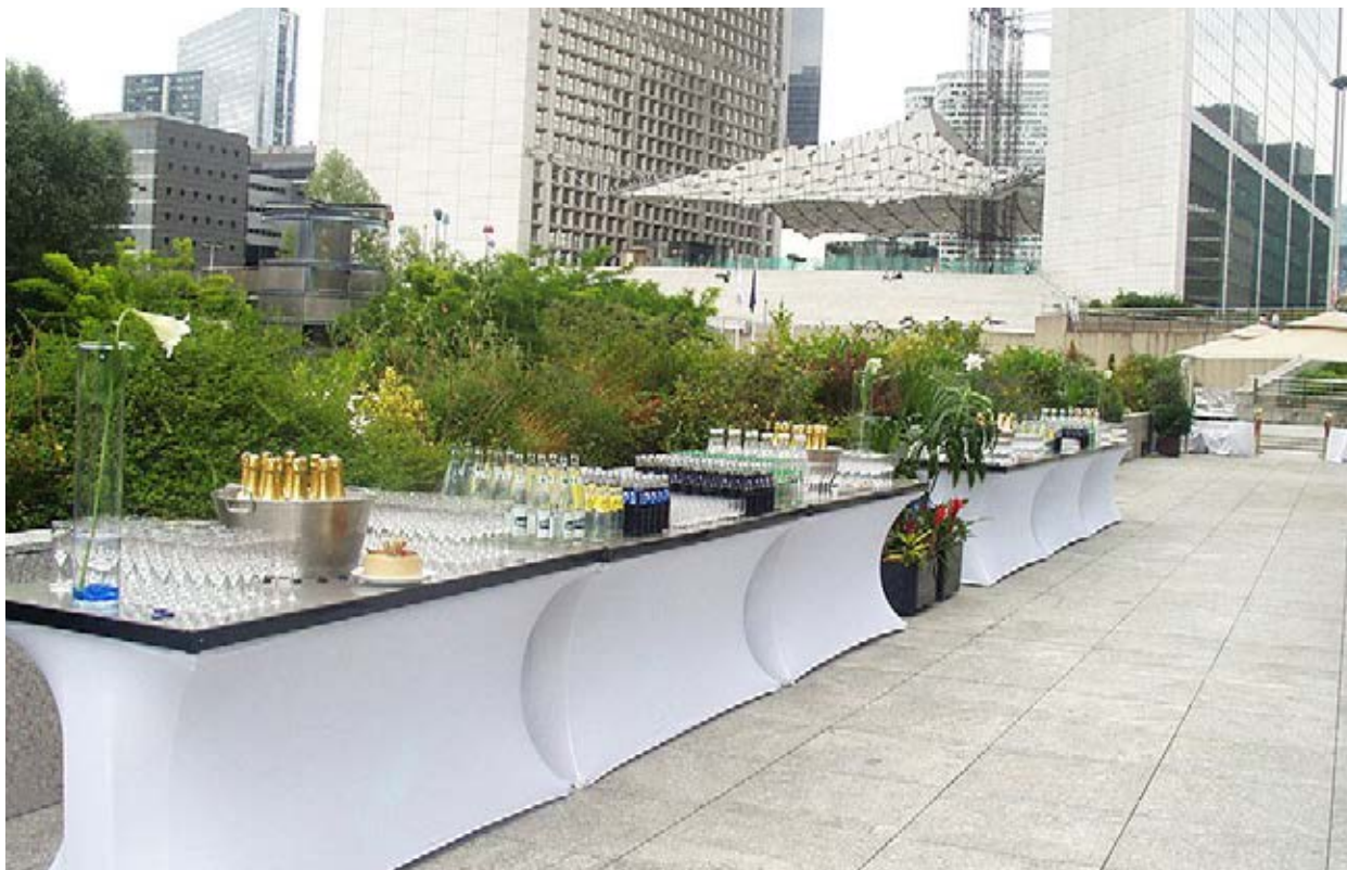
Renaissance Paris La Défense Hôtel