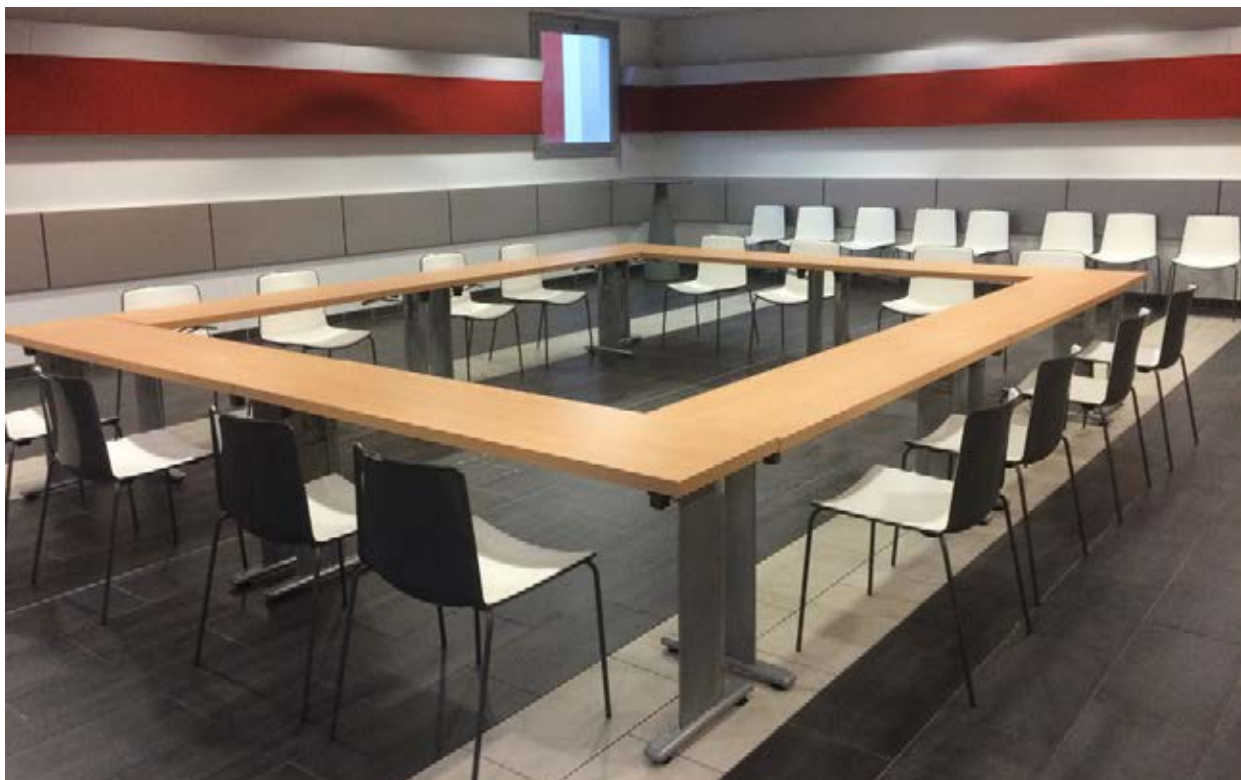
Lycée Hôtelier de Marseille