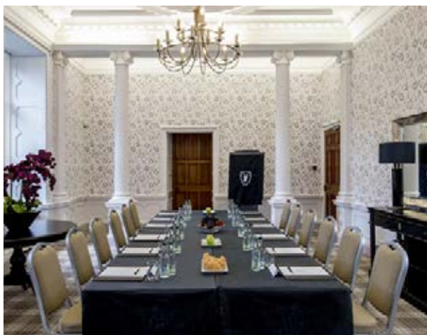
Vale Resort Hensol Castle