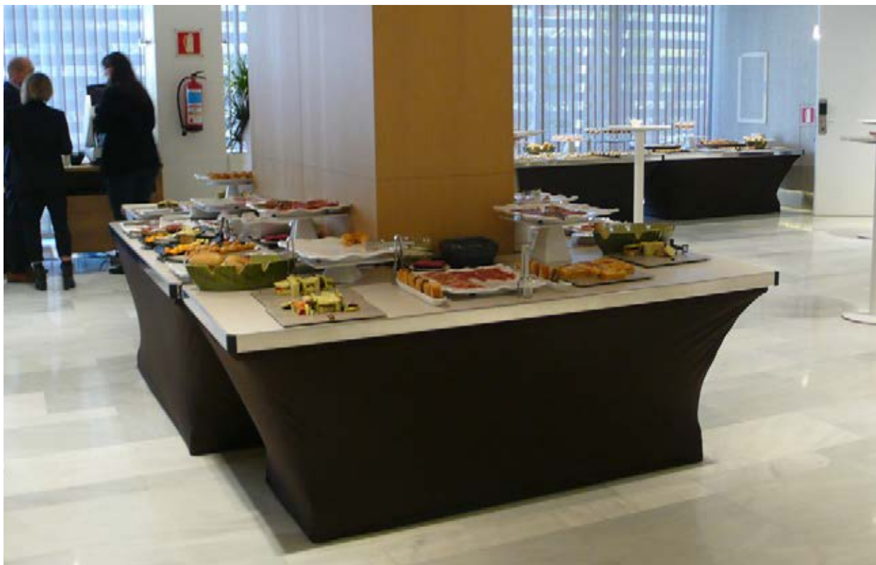
NH Collection Madrid Eurobuilding