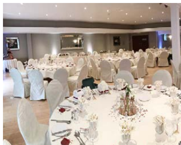
Best Western Plus The Connaught Hôtel