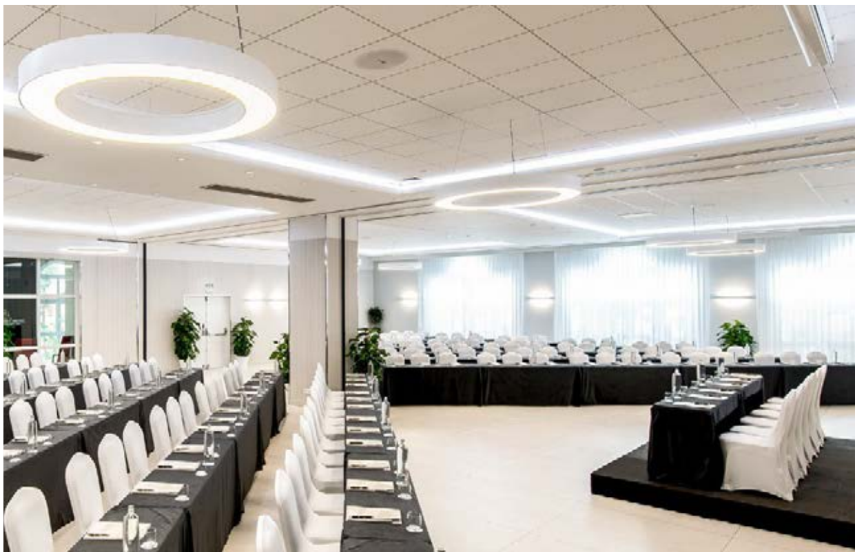
Olivia Nova Beach & Golf Hôtel ©