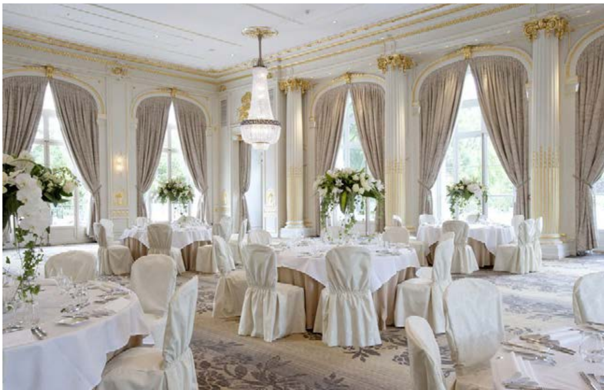
Waldorf Astoria Trianon Palace Versailles