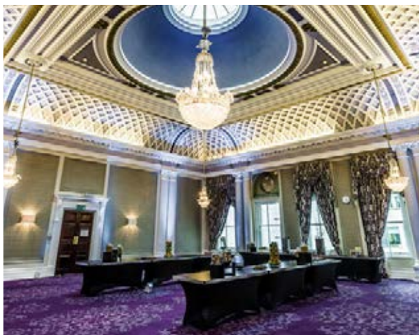
De Vere Grand Connaught Rooms

Le secret de nos housses extensibles en stretch est la teneur élevée en lycra (20%), ce qui signifie qu'elles conservent leur forme, nous ajoutons aussi des coutures doubles pour plus de solidité. Elles sont disponibles dans un grand nombre de coloris, et on peut même réaliser des housses bicolores. Elles sont très facilement lavables. Nos housses extensibles peuvent être personnalisées avec un message publicitaire ou avec votre logo en sérigraphie, pour un effet incontournable.